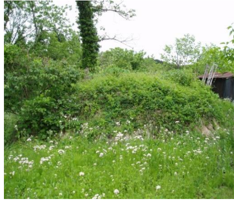
灰爪で兵士を埋葬したと伝えられる塚(4基ある)