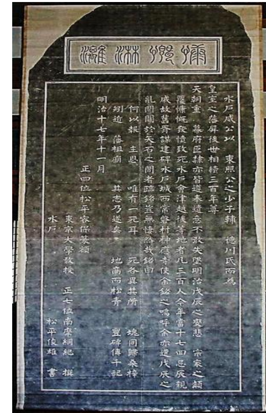
慷慨淋漓の碑・拓本