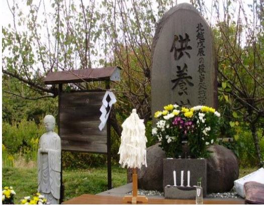
灰爪の丘の供養塔