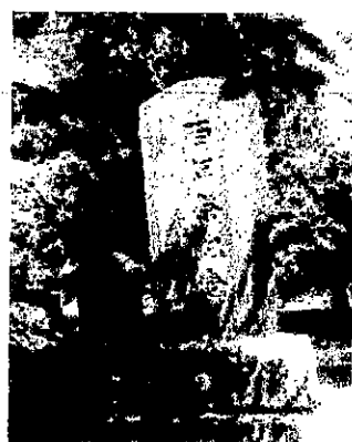
昭和41年10月14日 建碑 水戸藩国事殉難者百年祭記念碑